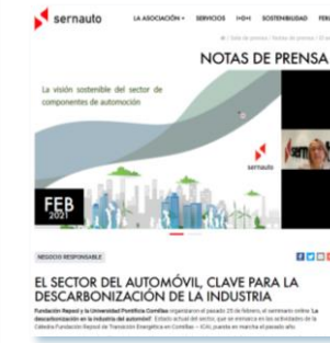
Colaboración con la Cátedra de Transición Energética