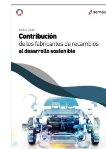
Especial Contribución Fabricantes de recambios