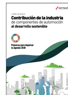
Libro Blanco del Sector Componentes de automoción