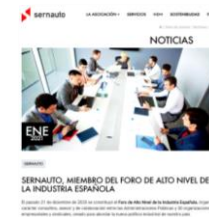
Foro de Alto Nivel