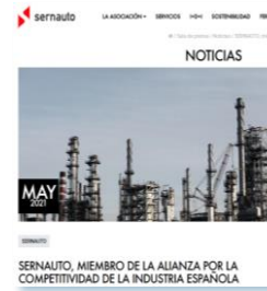
Alianza para la Competitividad