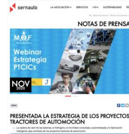
Move to Future (M2F)

3.4 Establecer conexiones con AAPP para impulso de ayudas y subvenciones