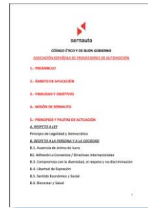
Código ético y de BG