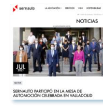
Mesa de Automoción