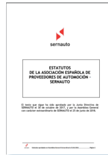
Estatutos de SERNAUTO