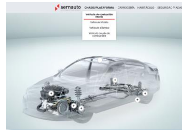
Mapa de componentes