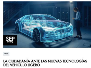
Nuevas tecnologías de movilidad