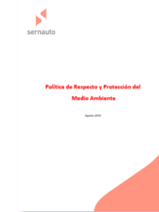
Política Medio Ambiente