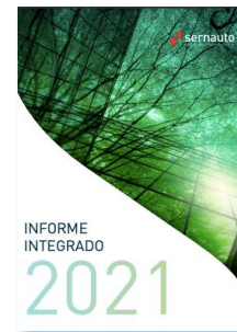
Informe Integrado 2021