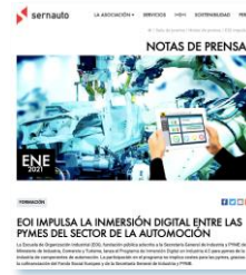
Digitalización y formación Pymes