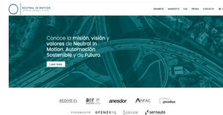
Neutral in Motion