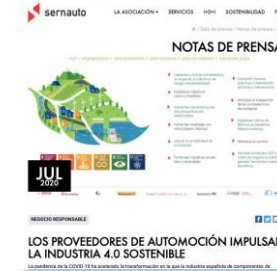
Industria 4.0 5