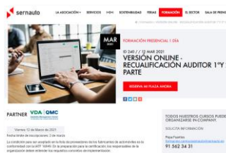
Plan de formación VDA Campus Sernauto (diversificación temáticas)