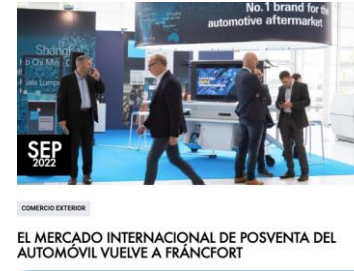
Presencia ferias internacionales