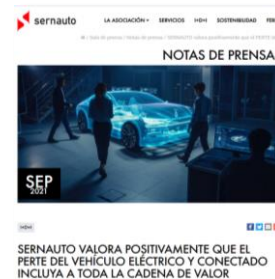
Estrategia PERTE VEC.