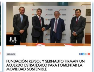
Acuerdos para la movilidad sostenible