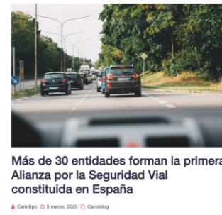
Alianza por la Seguridad Vial