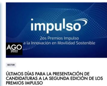
Premios IMPULSO a la Innovación en Movilidad Sostenible