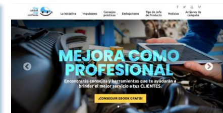
Elige Calidad, elige confianza