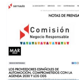
Comisión Negocio Responsable e impulso sostenibilidad desde SERNAUTO