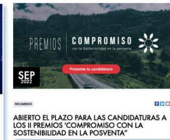
Premios Compromiso con el desarrollo sostenible